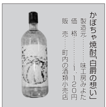
かぼちゃ焼酎「白爵の想い」 製造元……………味工房みよた 価格……………1,200円 販売……………町内の酒類小売店