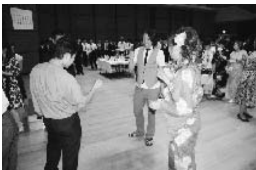
平成19年度 成人式の様子