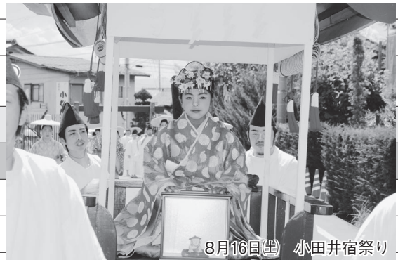
8月16日(土) 小田井宿祭り

広報に関するご意見、ご感想をお寄せください。また、掲載された写真をお譲りしますので、役場総務課にお越しいただくか、電話でご連絡ください。ただし、ご希望に添えない場合もありますのでご了承ください。 ●総務課(内線26番)