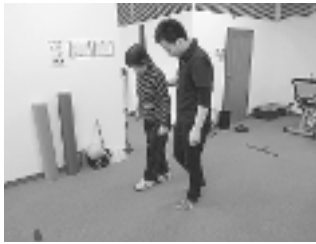
初回と最終回に身体能力測定を行います。3カ月間の運動の効果をデータで確認することができます。

※ご利用になるには、「要支援認定」もしくは基本チェックリストによる「事業対象者認定」を受け、地域包括支援センターにて個別の計画書を作成する必要があります。詳細はお問い合わせください。