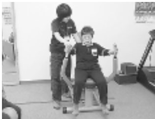
運動の方法、マシンの使い方はスタッフが分かりやすく説明しますので、より安全で効果的な運動を行うことができます。認知症予防のための頭の体操メニューもあります。