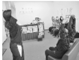
毎回教室の初めに血圧測定や準備体操を行います。