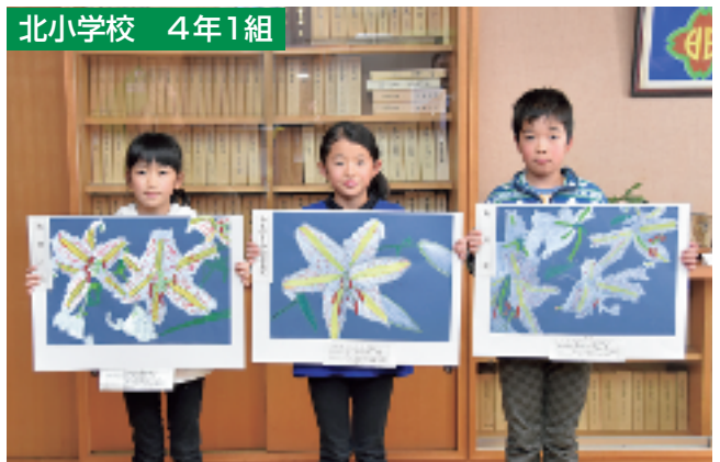
教育長賞 やまゆりの会会長賞 町長賞