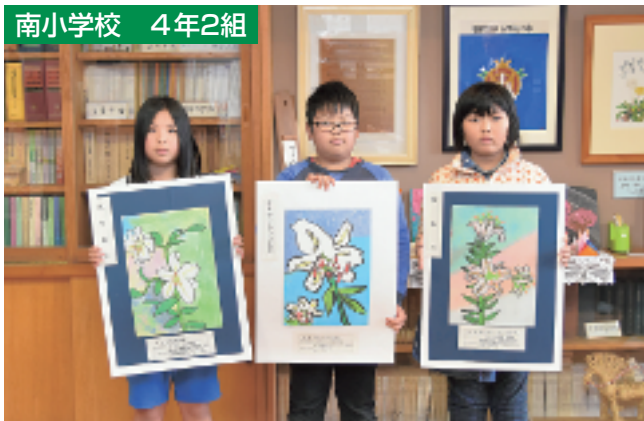
教育長賞 やまゆりの会会長賞 町長賞