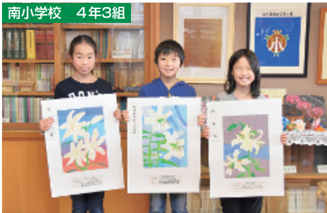
教育長賞 やまゆりの会会長賞 町長賞