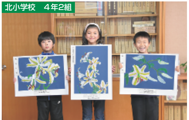
教育長賞 やまゆりの会会長賞 町長賞