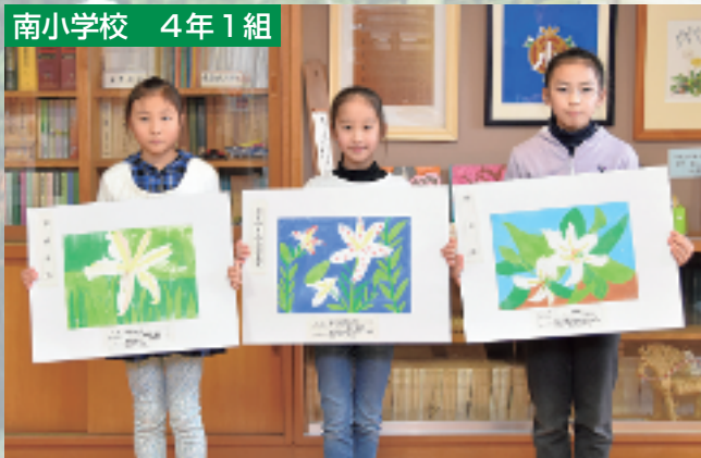
教育長賞 やまゆりの会会長賞 町長賞

やまゆりの会のご協力により、町花やまゆりに親しんでもらい、郷土の素晴らしさを感じてもらおうと、毎年小学4年生を対象に絵画展を行っています。入賞作品をご紹介します。