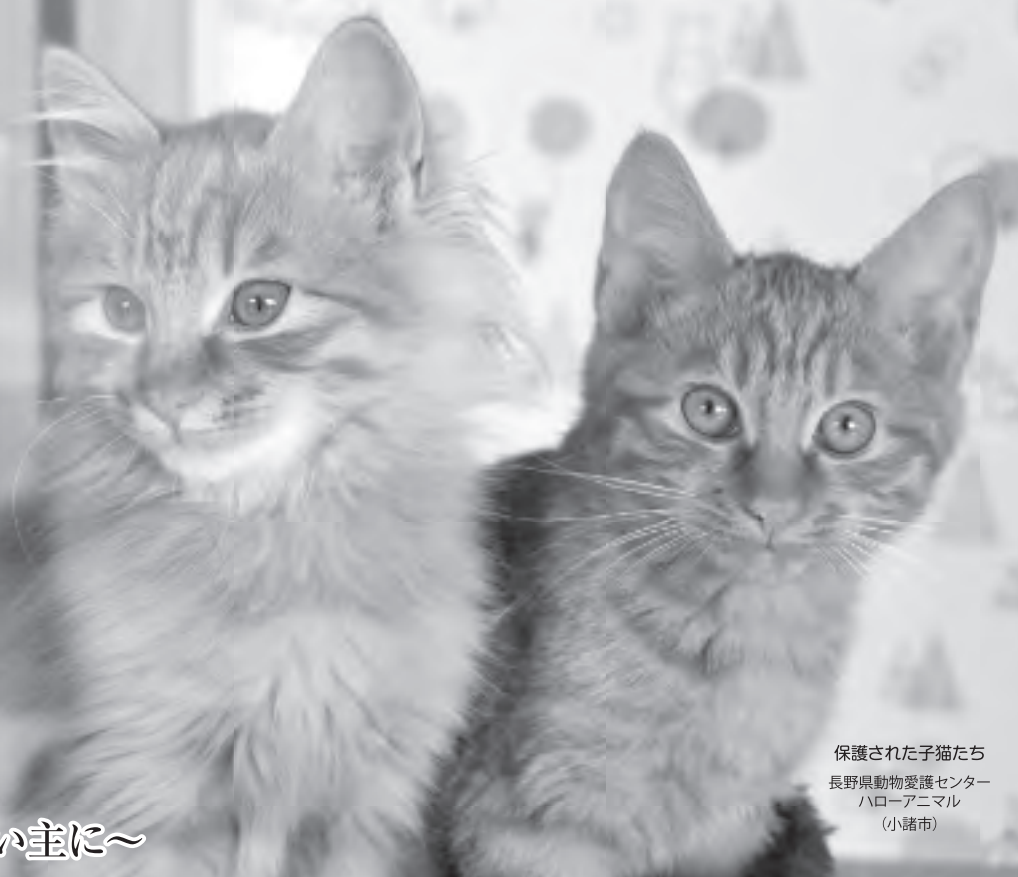
保護された子猫たち 長野県動物愛護センター ハローアニマル (小諸市)