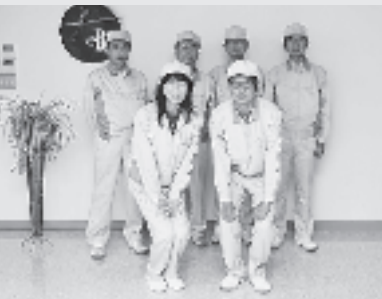
御代田町がギネス世界記録認定を受ける技術 を持つ企業がある町であることに誇りを持って いただけたら嬉しいと話す開発チームの皆さん。

※匠ニッポンプロジェクト 日本の技術者、研究者、職人たちのあくな き探究心・挑戦心を刺激し、その力を世界に 発信することを応援するギネスワールドレ コーズジャパンのプロジェクトです。