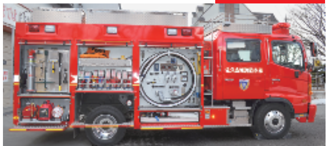
▲右側面 火災時に使用する器具

火災時、水を出すだけでなく、泡を出せる装置も取り揃え、より効果的に火災を鎮圧させるほか、水損防止に努めることができます。また、上部の照明器具は、夜間の活動時80メートル先まで照射することができます。