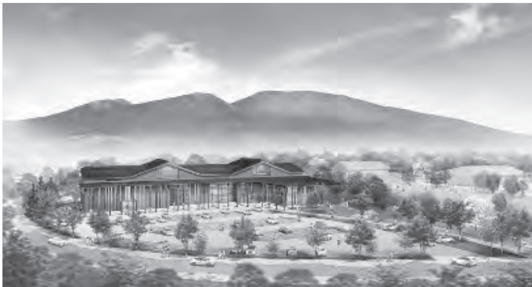
外観イメージ図(プロポーザルでの提案)

新役場庁舎建設は、旧メルシャン跡地の西側、約1万平方メートルを移転候補地として、計画を進めています。現在進めている御代田町役場庁舎建設委員会、基本設計について、町民の皆さまに報告します。