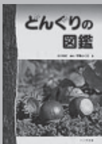
『どんぐり図鑑』 北川尚史/監修 伊藤ふくお/著 トンボ出版

また、コナラのように、一年ごとに実を成熟させるもの、クヌギのように、冬を越して二年かけて実を成熟させるものがあります。樹皮や葉、雌花や雄花、冬芽など、秋以外の季節の写真も掲載されていますので、秋にどんぐりを見つけたら、一年を通して観察してみるのも面白いのではないのでしょうか。