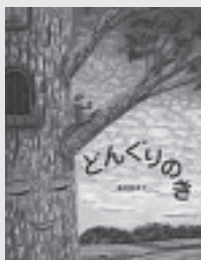
『どんぐりの木』 亀岡亜希子/作 PHP研究所

数年が過ぎて、一匹のリスが、どんぐりの木に住みつきます。ほかのリスは、「この木にはどんぐりがならない」「なつてもまじい」などと言います。でも、木に住んでいるリスは、木のこと大好きです。木はリスのために、その秋はおいしい実をたくさんつけました。