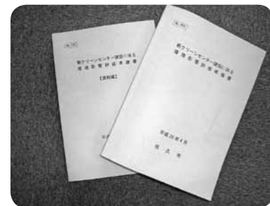
環境影響評価準備書

今後は、総合評価や事後調査の計画が確定後、面替区・児玉区・豊昇区との地区基本協定を締結していく。