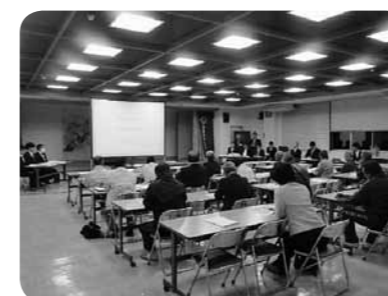
環境影響評価準備書説明会

の近い場所に迷惑施設が建設される事に非常に困惑している。当初は要望書提出が建設同意と誤認される事を心配していたが5月10日提出期限のアンケートを全区民に実施した。5月15日の第一回要望検討委員会後、同委員会4回区役員、佐久新クリーンセンター整備推進室、町民課による三者会議を3回開催した。疑問や不信の払拭に努め、面替区のベースを重要視して取りまとめに協力していく。