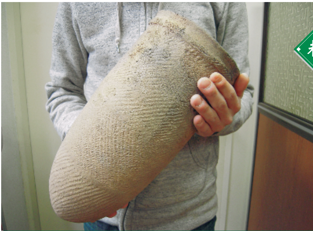
下弥堂遺跡の6,000年前の尖底土器