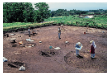
下弥堂遺跡の発掘風景

そのままでは立たない砲弾のような形の土器が、御代田町塩野の塚田遺跡や下弥堂遺跡から、平成3年大量に発見された。今から6,000年前のもので、底が尖っていることから尖底土器と呼ばれている。この土器は、調理に使用されたとみられるが、自立できないので地面に埋めるか、石で周囲を囲うなどして使われたものと考えられる。