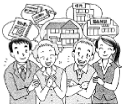
成年後見制度に関することは、地域包括支援センターへご相談ください。 電話(31)2510

成年後見制度は平成12年に始まりました。法定後見制度の手続きをとる人は現在全国で29万人以上います。その手続きの半数は子どもや兄弟がとっています。ということは、判断能力が衰えてから親族が必要と感じて手続きをとることが多いことになりました。手続きは本人が親族が行いますが、身寄りのない方は市町村長が代行します。市町村長による手続きは制度開始年から比べると約200倍に増えています。