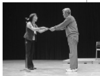
ステージの上で、表彰させていただきました