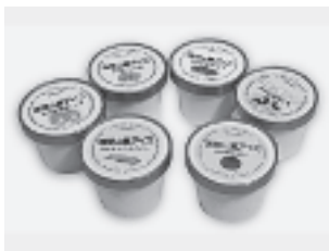
おらん家 「浅間山麓アイス」