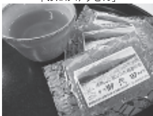
日穀製粉 「純そば茶」