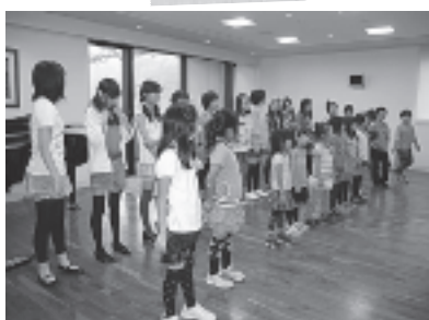
少年少女合唱団 つばさ