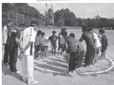
キックベース大会