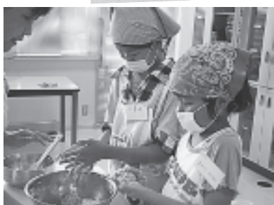
親子ふれ愛料理教室