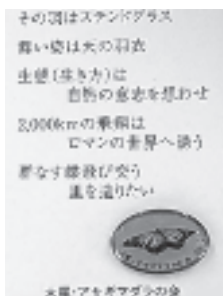
大星・アサギマダラの会 「アサギマダラピンバッジ」