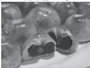
ベーカリーカフェ Cocorade 「中山道心楽deあん」