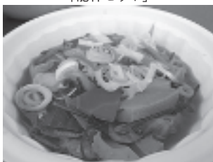
商工会 「おにかけうどん」