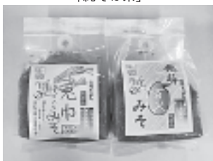
味工房みよた 「発芽玄米みそ・兔巾みそ」