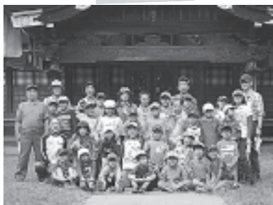
こども自然探検隊

町公民館では、幼児 *1 から中学生を対象に青少年育成事業として活発な活動をしています。 各事業は、毎年4月から小学校・中学校・広報「やまゆり」などを通じて参加者募集 *2 をしています。 ( *1 ：親子参加事業において *2 ：少年少女合唱団「つばさ」は常時団員を募集しています)