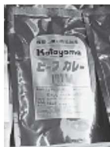
(有)片山肉店 「浅間山麓の高級伽厘ビーフカレー」