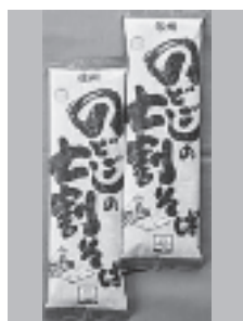
やまいし(株) 「七割そば」