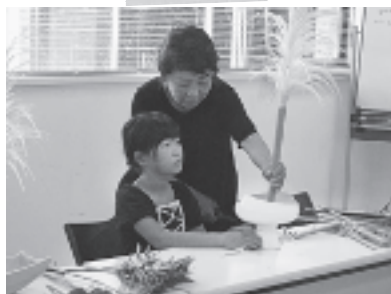
子ども生け花教室