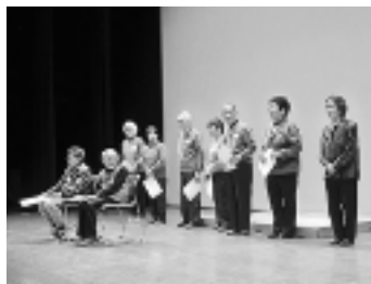
ステージの上で、表彰させていただきました