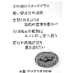
ピンパッチ アサギマダラ