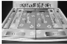
浅間山麓蕎麦便りギフト