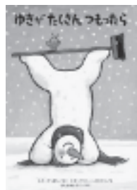
『ゆきがたくさんつもったら』 ルク・デュポン／さく ヒド・ファン・ヘネヒテン／え フレーベル館

お日さまが出てくるとだんだん溶けていってしまいますが、大丈夫です。雪がたくさん積もつたら、またゆきだるまに会えますよ。