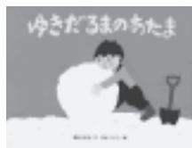
『ゆきだるまのあたま』 黒田かおる／作 せなけいこ／絵 金の星社

やがて男の子が戻って来て、頭を作つてのせてくれました。やつとできた頭にゆきだるまは喜びました。