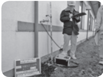
空間放射線量の測定