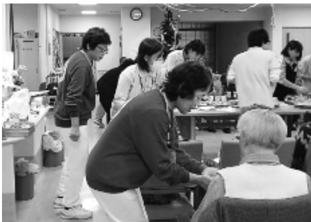
ニチイケアセンターみよたにて、レクリエーションのお手伝い中。 緑のトレーナーを見かけたら、気軽に声をおかけください！

ても、地域とのつながりはよい刺激になってありがたい」との声が聞かれています。この活動を通じ、サポーターが今後とも介護施設と地域をつなぐ重要な役割を担っていくことを改めて感じました。引き続き、住民と介護施設と行政が手を取り合って、高齢者の生活を支えていける町づくりを目指したいと考えています。