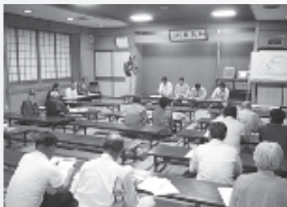
森林整備モデル 団地の説明会

佐久地域の皆さまに森林づくりや木材利用などへのご理解をいただくために、普及啓発活動、企業と地域の交流、子どもから大人まで参加できる学習機会の創出(木育活動)などの取り組みを支援しています。