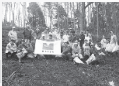
企業による 森林整備