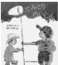
『せみとりめいじん』 (かがくのとも傑作集) かみやしん/作 福音館書店

耳をすませると、色々なセミの 声の間聞こえてきます。どれがどの セミの声か、分かるようになった ら、本当の名人です。