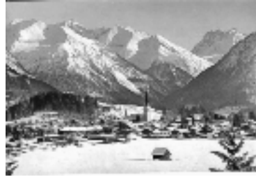
ドイツ・オーバズドトルフ(絵葉書より)

さて、スコットランドの人たちはご存知のように「ゴルフ」「ラクビー」「サッカー」を考案した何とも素晴らしい人たちはです。また共通しているルールは審判があまり試合に介入しない、セルフジャッジのスポーツで、「ラクビー」では「ノーサイド」という言葉があるように試合が終わったら「みんな友だちだよ」と「スポーツマンシップ」をうたっていてロッカールームの横のシャワールームは一つです。カーリングもそんな雰囲気のあるスポーツです。