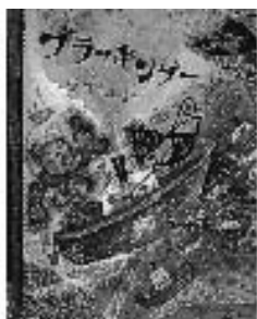
『ブラッキンダー』 スズキコージ／作・絵 イースト・プレス

魚たちと船がぐるぐる回ってきたドーナツを追って、船は砂漠やとんがり山も行き、二人は大冒険をしました。