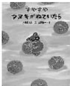
『すやすやタヌキがねていたら』 内田麟太郎／文 渡辺有一／絵 文研出版

タヌキは、木の下や海、浜辺、秋のススキ野原でも眠ります。みんなもつられて眠ります。きつと楽しい夢をみていることでしょうか。やさしい気持ちになれる、ナンセンス絵本です。