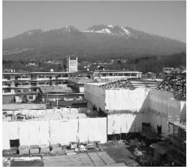
教室棟から管理・特別教室棟を望む