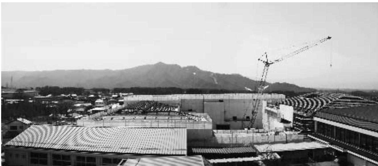
現在の中学校屋上から工事現場を望む