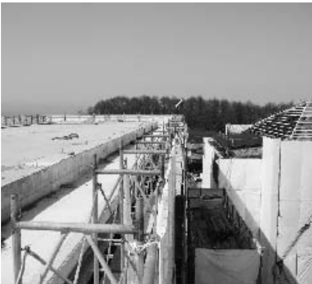
教室棟の屋上、屋内運動場を望む