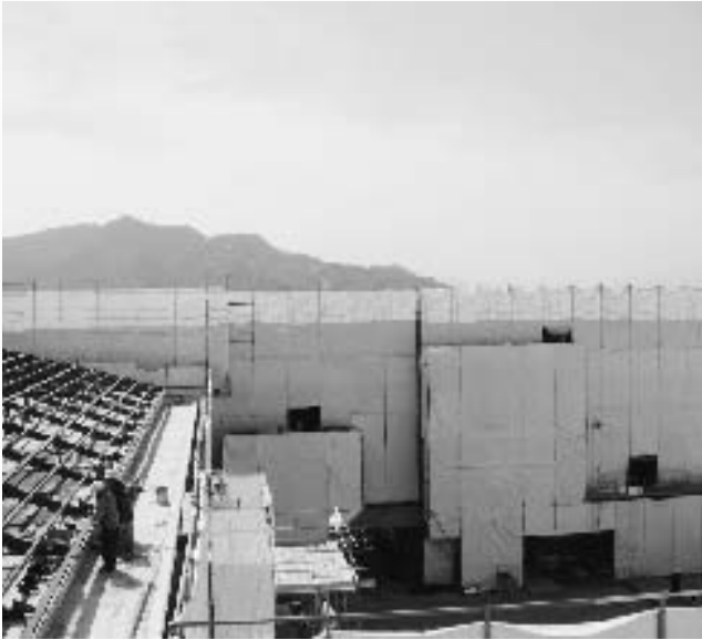
管理・特別教室棟から校舎棟を望む