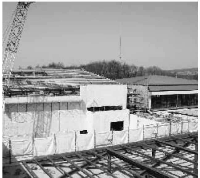
教室棟から屋内運動場を望む