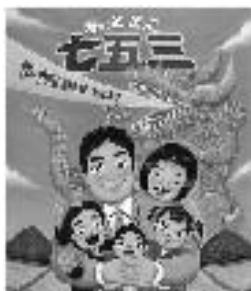
『ぎゅっただっこ七五三』 内田麟太郎/作 山本孝/絵 岩崎書店

『ぎゅっただっこ七五三』 実りの秋。お米も柿もたくさん 収穫できました。七歳の女の子、 五歳の男の子、三歳の男の子が怪 獣退治ごっこで遊んでいます。子 どもだけの遊びなので、お父さん は仲間に入れてもらえません。 次の日は七五三。みんなで神社 に行ってお参りをし、記念写真を 撮りました。さらに次の日、その 写真を見るとそこに写っていた のは…。 お父さんに読んでいただきました 一冊です。 (対象 幼児から)