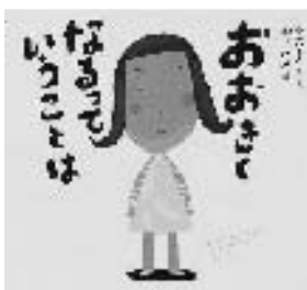
『おおきくなるって いうことは』 中川ひろたか/文 村上康成/絵 童心社

『ぎゅっただっこ七五三』 実りの秋。お米も柿もたくさん 収穫できました。七歳の女の子、 五歳の男の子、三歳の男の子が怪 獣退治ごっこで遊んでいます。子 どもだけの遊びなので、お父さん は仲間に入れてもらえません。 次の日は七五三。みんなで神社 に行ってお参りをし、記念写真を 撮りました。さらに次の日、その 写真を見るとそこに写っていた のは…。 お父さんに読んでいただきました 一冊です。 (対象 幼児から)