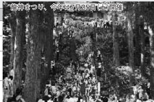
龍神まつり、今年は7月25日(土)開催