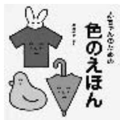
『赤ちゃんのための 色のえほん』 桑原伸之/絵と文 あすなる書房

『赤ちゃんのための色のえほん』 まずは、赤いコップが登場しま す。赤いコップから、ごそごそと、 少しずつ赤いりんごが出てきまし た。ほかに、青いかさ、黄色いポ ケットなどが登場しますが、コッ プと同じように中から何かが出て きます。何が出てくるかな？ ベースの色と登場するものの色 の対比が鮮やかで、赤ちゃんの目 にも印象的に映ることでしょう。