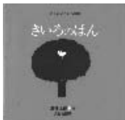
『きいろのほん』 五味太郎/作 文化出版局

スポーツの秋、読書の秋、 さまざまな楽しみ方がありま すね。 赤ちゃんでも、3、4ヶ月 頃になると大人と同じ色を知 覚できるのだそうです。赤 ちゃんにも芸術の秋を楽しん でいただきたいと思います。 今回は、「色の絵本」を紹介し ます。