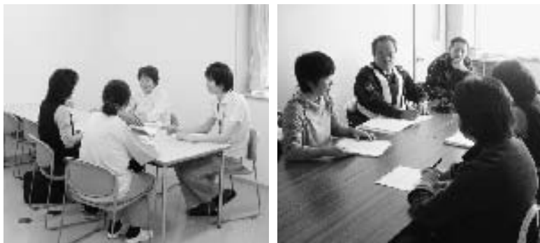
サービス担当者会議 ~よりよい支援のためにご自宅等で話し合いを持っています~

なお、改善が見られない場合や対応に不満がある場合は包括支援センターまでご相談ください。