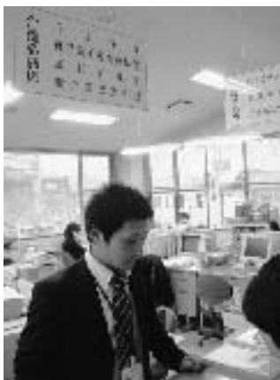
要介護認定申請窓口

調査や意見書など、認定にかかった費用は介護保険の財源から支出されるので、必要な時に必要な人が安心して使える介護保険制度を続けていくため、皆さまのご協力をお願いします。