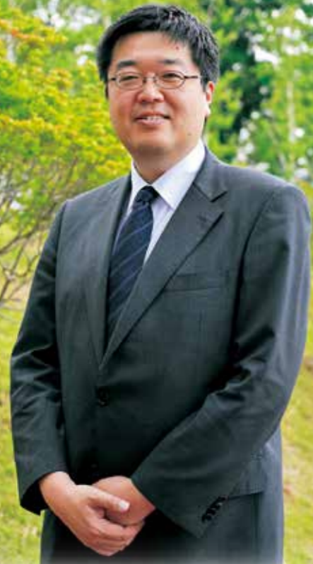
令和3年3月 御代田町長 小園拓志

御代田町ではこれまで、昭和51年(1976年)に策定した第1次御代田町長期振興計画以来、45年間、計画行政を着実に実行し、人口は現在も増加を続けています。平成に入って最初の平成2年(1990年)国勢調査で11,895人だった人口は、令和2年(2020年)では約15,500人まで増え、人口減少社会にあっても多くの皆さまに選ばれる町となっています。