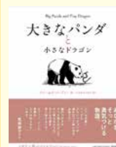
『大きなパンダと小さなドラゴン』 ノーブリー/著 せきねみつひろ/訳 出版: サンマーク出版

『地図でスッと頭に入る アフリカ55の国と地域』 グローバルサウスの成長株アフリカは、世界が取り合う「投資先」。変貌を遂げ続けるアフリカ55の国と地域の歴史、文化、政治、経済などについて、イラストや写真、地図を交えて平易な文章で説明します。