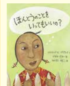
『ほんとうのことをいっていいの?』 パトリア・Cマキサック/文 ジゼル・ポター/絵 ふくもとゆきこ/訳 出版: BL出版

『三つ編み』 インド、イタリア、カナダ。3大陸の3人の女性。かけ離れた境遇に生きる彼女たちに共通しているのは、女性に押しつけられる困難と差別のために立ち向かっていること…。逆境を生きる女性の連帯を描く物語。