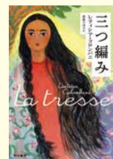
『三つ編み』 レイシア・コロパニ/著 齋藤可津子/訳 出版: 早川書房

言葉のすべてが心に沁みわたります。こんな風に相手を思いやれたら、世の中から戦争なんてなくなるのに…。『大きなパンダと小さなドラゴン』 大きなパンダと小さなドラゴンは、季節をめぐる旅に出かける。しよつちゆう道に迷いながらも、道すがら、美しいものをたくさん見つけ…。仏教の哲学と教えをヒントに、困難な時期を乗り切るために役に立つ考え方を紹介する。