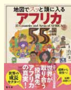
『地図でスッと頭に入る アフリカ55の国と地域』 白戸圭一/監修 出版: 昭文社

『地図でスッと頭に入る アフリカ55の国と地域』 グローバルサウスの成長株アフリカは、世界が取り合う「投資先」。変貌を遂げ続けるアフリカ55の国と地域の歴史、文化、政治、経済などについて、イラストや写真、地図を交えて平易な文章で説明します。