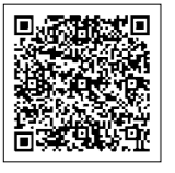
能登半島地震 支援関係