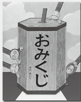
『おみくじ』 きたあいら / 作 出版：BL出版

心を込めて手作り、年神様をお迎えできればステキです 「しめ飾り造形とその技法 藁を織い、春を寿ぐ ことほぎ」 しめ飾りとは、日本の稲作文化と深く結びついた「春を迎えるかたち」。稲を育て、藁をつくり、縄を織う。しめ飾りをつくるプロジェクト「ことほぎ」の2人が、しめ飾りの歴史や制作技法などを紹介する。