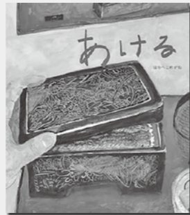
『あける』 はらべこめがね / 著 出版：偕成出版社

「おあとがよろしいようで」 金も夢も友もない上京したての大学生・暖平は、ひよんなことから落語研究会に入ることに。落語が繋ぐ仲間との出会いが、彼の人生を大きく変えていき…。書き下ろし人生応援小説。