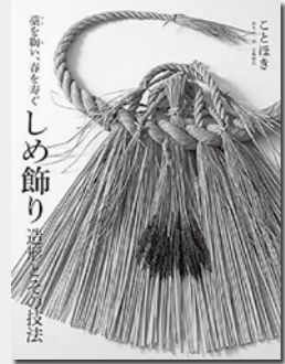
『しめ飾り造形とその技法 藁を織い、春を寿ぐ ことほぎ』 鈴木安一郎ほか / 著 出版：誠文堂新光社

心を込めて手作り、年神様をお迎えできればステキです 「しめ飾り造形とその技法 藁を織い、春を寿ぐ ことほぎ」 しめ飾りとは、日本の稲作文化と深く結びついた「春を迎えるかたち」。稲を育て、藁をつくり、縄を織う。しめ飾りをつくるプロジェクト「ことほぎ」の2人が、しめ飾りの歴史や制作技法などを紹介する。