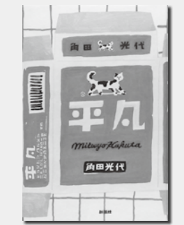
「平凡」 角田光代/著 出版：新潮社

生き物をまねっこして、みんな があっと驚く発明してみない? 「すごい! ミミックメーカー 生き物 をヒントに世界を変えた発明家たち」 カワセミが新幹線に!? 葉っぱが太 陽電池に!? ザトウクジラが風力発電 に!? 生き物から学び、自然のすぐれ たところをまねて、便利な発明品を 作った10人の「ミミックメーカー」の 物語を紹介する。