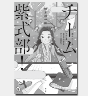
「チーム紫式部!」 楠木誠一郎/作 酒井以/絵 出版：静山社

誰もが想像してしまう、選ばな かった方の未来…どれを選んで も私の人生なのだ。 「平凡」 もし、あの人と結婚していなければ、 別れていなければ。仕事を続けていれ ば。どんなふうに暮らしたって、絶対 選ばなかった方のことを想像してしま う…。6人の「もし」を描いた小説集。