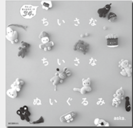
「ちいさなちいさなぬいぐるみ クスッと笑えるモチーフ34点」 aska./著 出版：誠文堂新光社

「ちいさなちいさなぬいぐるみ」 クスッと笑えるモチーフ34点 くま、パンダ、うさぎ、お相撲さん、 鬼と金棒、しみしおでん、新鮮おや さい、おむすび、ガイコツおぼけ…。 全長約5冊、ちいさくてゆる〜い雰囲気 のぬいぐるみを紹介します。