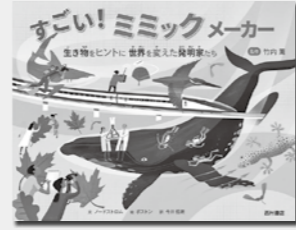
「すごい! ミミックメーカー 生き物をヒントに世界を変え た発明家たち」 竹内薫/監修 ノードストロム/文 ポストン/絵 今井悟朗/訳 出版：西村書店

「ちいさなちいさなぬいぐるみ」 クスッと笑えるモチーフ34点 くま、パンダ、うさぎ、お相撲さん、 鬼と金棒、しみしおでん、新鮮おや さい、おむすび、ガイコツおぼけ…。 全長約5冊、ちいさくてゆる〜い雰囲気 のぬいぐるみを紹介します。