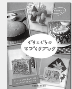
『ぐりとぐらのてづくりブック』 福音館書店編集部 / 編著 出版：福音館書店

読み進めると心が動き出します。 『とんとんとんのこもりうた』 南の島にすむアマミノクロウサギの赤ちゃんは、巣穴にひとりでお留守番。とんとんとん、とんとんとん……。お母さんうさぎが穴をふさぐ音が、赤ちゃんの耳には子守歌。アマミノクロウサギの不思議な子育てを描いた絵本。