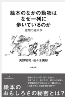
『絵本のなかの動物はなぜ一列に歩いているのか 空間の絵本学』 矢野智司 ほか / 著 出版：勁草書房

絵本の持つ力がよく分かる本 『絵本のなかの動物はなぜ一列に歩いているのか 空間の絵本学』 どうして絵本には、動物たちが一列に行進している姿が描かれるのか。絵本作家が作りだした他に類のない絵本世界を象徴する構図を読み解き、絵本世界がもたらす「絵本の力」の謎について考察する。