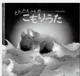
『とんとんとんのこもりうた』 いもようこ / 作・絵 出版：講談社

絵本の持つ力がよく分かる本 『絵本のなかの動物はなぜ一列に歩いているのか 空間の絵本学』 どうして絵本には、動物たちが一列に行進している姿が描かれるのか。絵本作家が作りだした他に類のない絵本世界を象徴する構図を読み解き、絵本世界がもたらす「絵本の力」の謎について考察する。