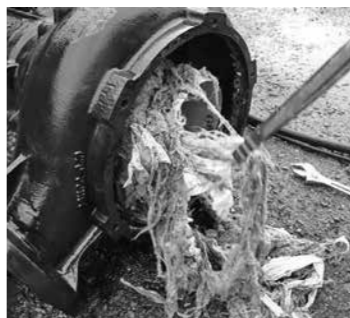
ポンプに詰まった繊維物

下水道は、皆さんの大切な共有財産ですので、トイレ、トイレットペーパー以外の物は流さず、正しく使用してください。