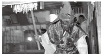
熊野皇大神社 太々神楽