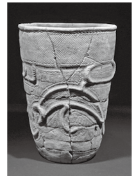
生き物の姿が見える縄文土器 (井戸尻考古館蔵)

日時…10月1日(日)～11月23日(祝) 入館料…大人500円 子ども(小学生～高校生)300円 休館日…10月2日・7日・10日・16日・18日・23日・26日・30日 11月6日・13日・20日