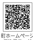
町ホームページ 二次元コード