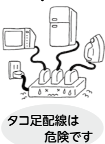
タコ足配線は危険です

高温多湿の夏場は、1年のうちで感電や電気事故の最も多い季節です。このため、経済産業省の主唱のもと、8月を「電気使用安全月間」として、全国一斉に電気使用安全を呼びかけています。 チェックポイント ●傷んだ電線、コードを使っていますか ●洗濯機、電子レンジにアースは取り付けてありますか ●漏電遮断器は取付けてありますか ●1つのコンセントからたくさん電気を使っていますか 電気の相談は 中部電気保安協会