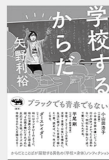
「学校するからだ」 矢野利裕／著 出版：晶文社

「学校するからだ」 広島出身ではないのに広島弁を操る ヤクザ的風貌の生活指導。肝心なこ ろで噛んでしまう著者自身…。現役教 員が学校のなかのへからだごとへことば が躍動する瞬間を拾い集めた、異色の 〈学校×身体〉ノンフィクション。