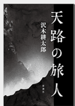
「天路の旅人」 沢木耕太郎／著 出版：新潮社