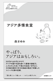
「アジア多情食堂」 森まゆみ／著 出版：産業編集センター

「アジア多情食堂」 中国、韓国、台湾、タイ、ベトナム、インド…。50代から60代にかけ てアジアの国々を訪ね歩いた著者が、 人々とのふれあいや食との出会いを 中心に、その国の歴史や文化を独自の 視点で考察したユニークな旅の記 録。読むと旅に出たくなる一冊です。