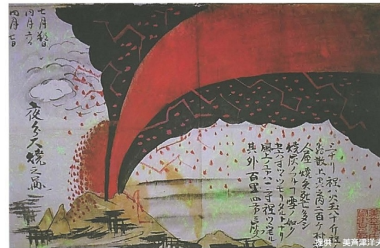
1783 (天明3) 年の噴火絵図 (浅間山夜分大焼之図)

天仁噴火は平安時代に発生した大噴火で、天明噴火ほどの記録は残っていません。追分火砕流、上舞台溶岩が流下し、火山噴出物の量は天明噴火の2倍以上であったと考えられています。