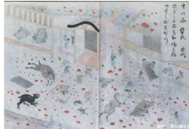
天明噴火時に高温の軽石や火山灰から逃げまどう人々 (浅間山焼昇之記)