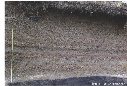
天明噴火で積もった軽石

降下火砕物 (降灰) は、一度の噴火の間でも風向きによってさまざまな方向に降ります。大規模噴火では、軽石も混ざって降ります。