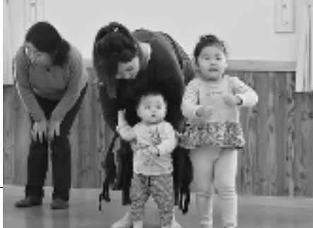
ひだまりっこ 「幼児体操」 (大林児童館)

子どもたちが遊び 親たちも楽しめる そんな交流の場があります。 親子で手をつないで ぜひ遊びに来てください。