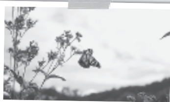
9月22日 面替 アサギマダラ