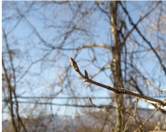
▲オシオウタンボク(枝先の冬芽) H28.3.17 撮影

佐久市・北佐久郡環境施設組合では、平成28年1月から3月までの新クリーンセンター整備事業の実施状況や環境保全措置の状況を取りまとめ、4月末に長野県環境部へ提出しました。この「施工状況等報告書」は、4半期毎に作成することとされており、今回で4回目の提出となりました。