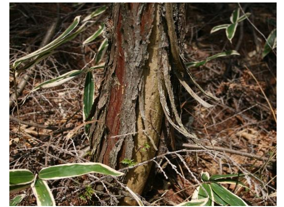
◀シカの被害にあった木の幹

森泉山財産組合では、平成14年に百周年記念として、9区の関係者が集まって植栽したのを機に、毎年継続的に森泉山の整備作業を続けています。昨年までは、枝打ち(下枝を切って落とす)作業を行ってきましたが、シカの被害が多くなったことを受け、今年の春は、ヒノキの幹に保護ネットを巻きつける作業を実施しました。