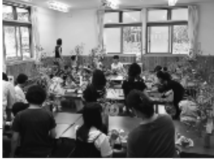
ひだまりっこ 「七夕飾りを作ろう」 (大林児童館)

子どもたちが遊び 親たちも楽しめる そんな交流の場があります。 親子で手をつないで ぜひ遊びに来てください。