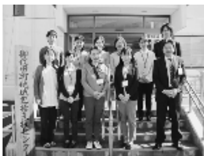
担当係の職員です。介護高齢係と地域包括支援係が連携し対応いたします。

高齢者が住み慣れた地域で、その人らしい生活を継続することが出来る「地域包括ケア」を目指していきます。お気軽にご相談ください。