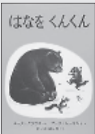
『はなをくんくん』 ルース・クラウド/ぶん マーク・サイモント/え きじま はじめ/やく 福音館書店

静かに雪の降る森の中、動物たちは体をまるめて冬眠中です。野ねずみも、くまも、ちっちゃななかつむりも、りすも、山ねずみも、みんな目を閉じてぐっすり……。おや？ でも、目を覚ましたようです。そして、ちよっぴり寝ぼけまなこで鼻をくんくん、何かに向かって走り出しました。いったい、何が起きたのでしょうか。