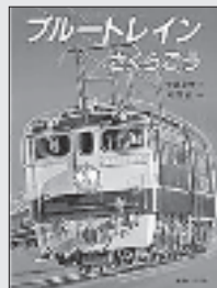
『ブルートレイン さくらごう』 中島 章作/え 砂田 弘/ぶん 復刊ドットコム

憧れの寝台特急「ブルートレインさくら号」の、東京から長崎までの19時間19分の旅を描いた絵本を復刊。まるで自分が乗っているかのような気分が味わえる。見返しに路線図あり。