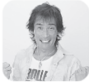
杉田あきひろ氏 NHK「おかあさんといっしょ」 9代目うたのおにいさん