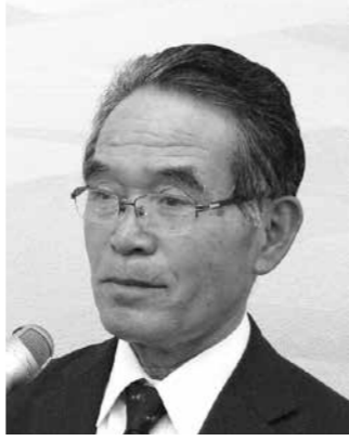
池田 健一郎 議員